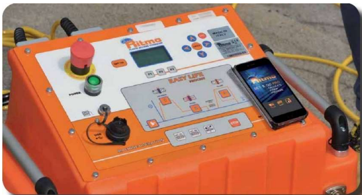
Report by EASY LIFE + "SET & GO! PRO"